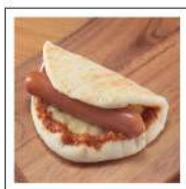
パーソナルスナック