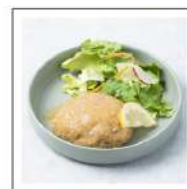
肉惣菜(ハンバーグ)