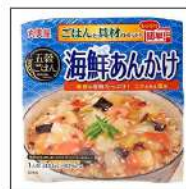
ごはん・具材セット