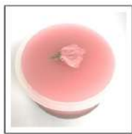
季節限定商品A(や さい)