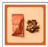
ミックスナッツ (Buddy Nuts)