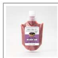
レンジでチンして食べるスムージー