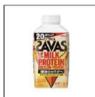
SAVASザバス ミルクプロテイン