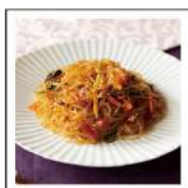
ピーフン・チャプチェ