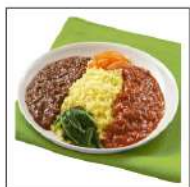
いまだきごはん(ライスボウル)