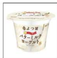
カップヨーグルト