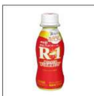
明治プロビオヨーグルトR-1ドリンク