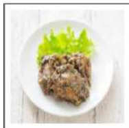
お肉料理(鶏肉メニュー)【無添加】