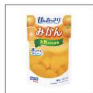
シロップ入りフル ーツ