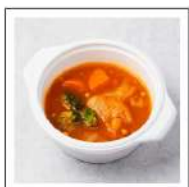
具だくさんスープ