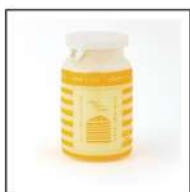
カップヨーグルト (大)