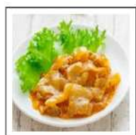
肉惣菜(牛・豚肉料理)