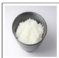
ごはん(白米)【無添加】