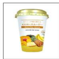
イエロースムージー