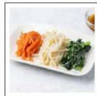
レンジでチンして食べる温野菜サラダ【無添加】