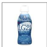
明治プロビオヨーグルトLG21ドリンク