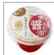
レンジ調理ラーメン