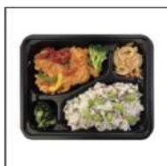
医師監修ヘルシー 弁当