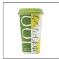
フルーツジュース