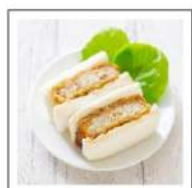
サンドイッチ(冷凍)