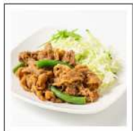
お肉料理(牛肉メニュー)【無添加】