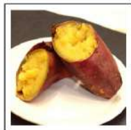
焼き芋(冷凍)【無添加】