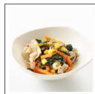
お肉料理(豚肉メニュー)