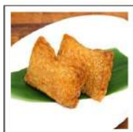
季節限定商品B(ごはん)