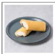
クレープバー【無添加】