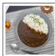
カレー類(1)(ビーフカレー)