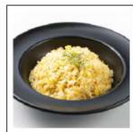
ごはん(和食・中華)