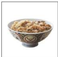
吉野家ミニ牛丼の 具