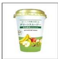
グリーンスムージー