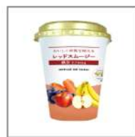
レッドスムージー