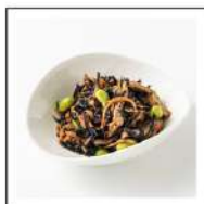
副菜(野菜料理)【無添加】